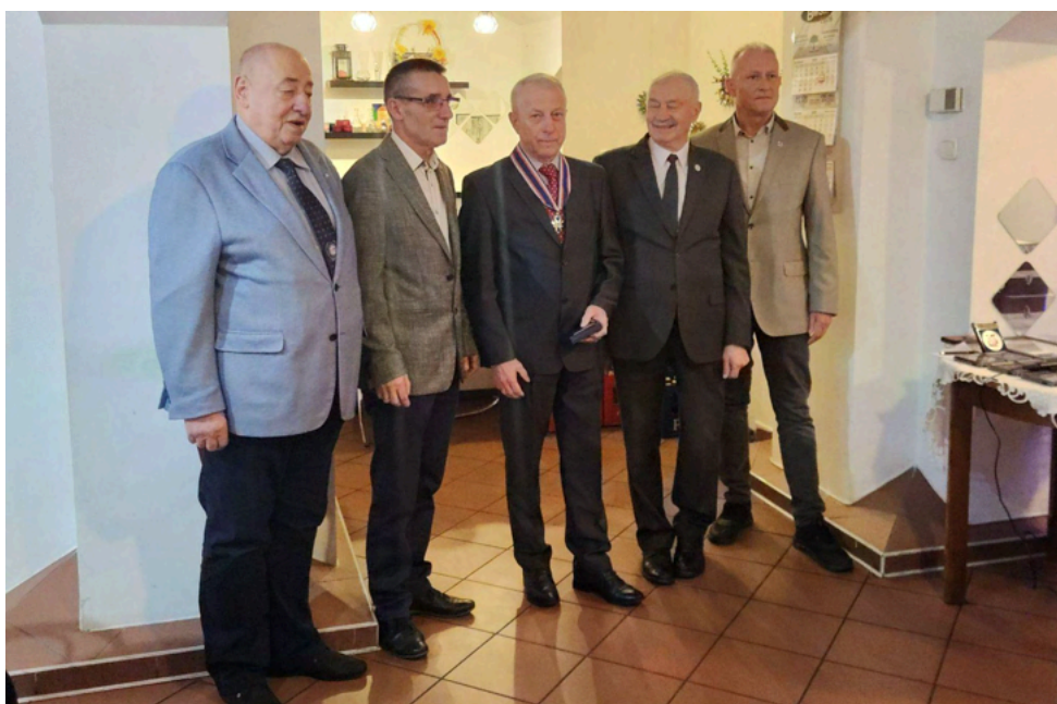
Treść: Jarosław Fikus